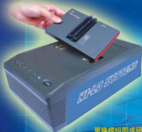
更换模组即成研发用